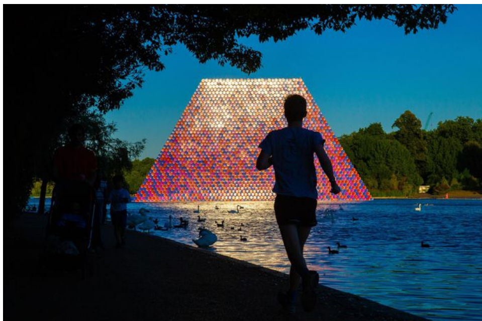
Londoni Hyde parki järvel Christo uus kunsteios.