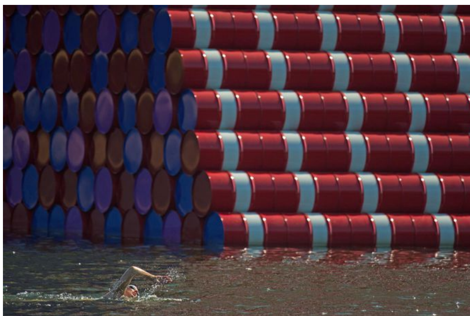
7000 õlitunnist tehtud tahukana ulpiv saar Londoni Hyde parki järvel, autor Christo.